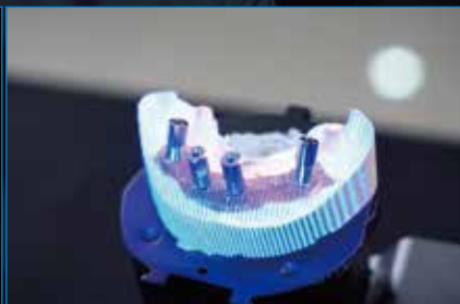
Мост на имплантах